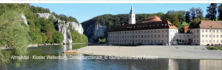
Altmühltal - Kloster Weltenburg, Donaudurchbruch