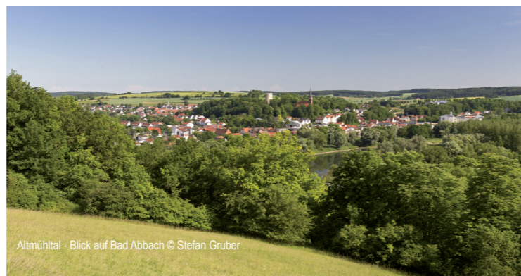
Altmühltal - Blick auf Bad Abbach