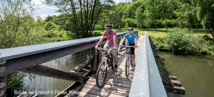
Brücke bei Enseldorf