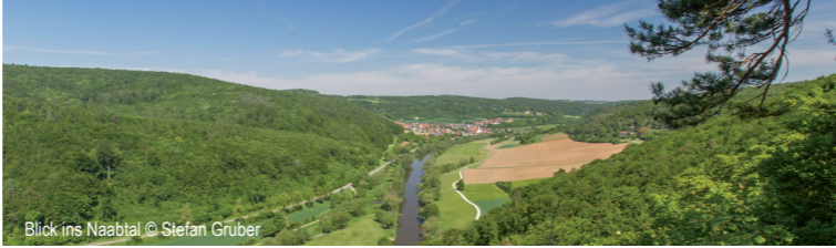
Blick ins Naabtal