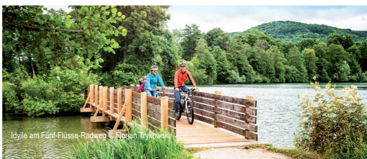
Idylle am Fünf-Flüsse-Radweg